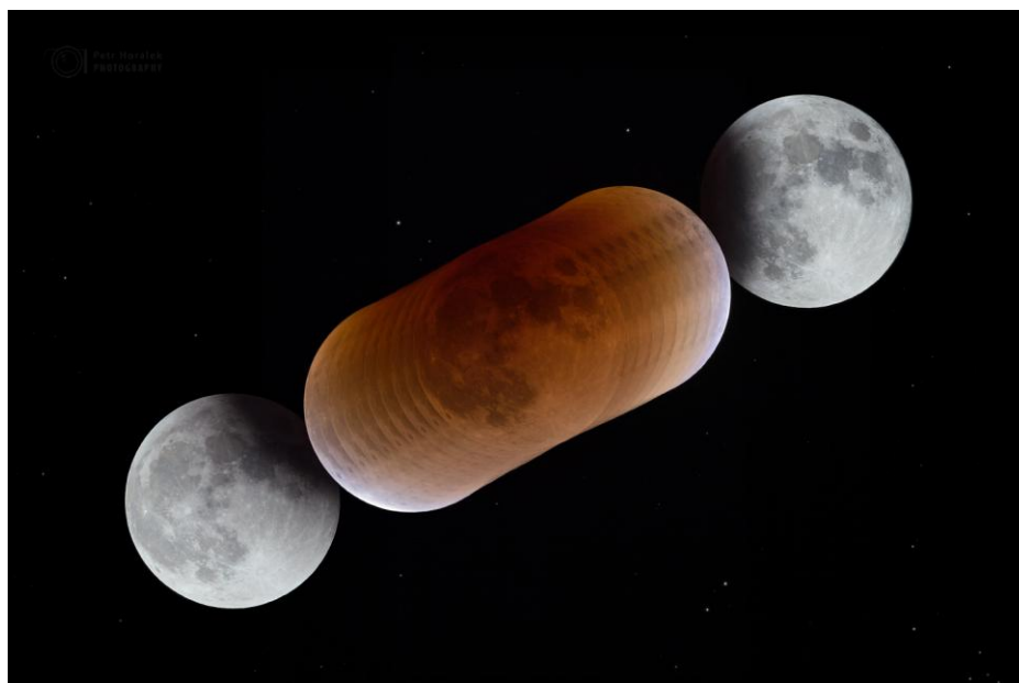
Průběh ztmění Měsíce a barev v zemském stínu zachycených během úkazu 31. ledna 2018.