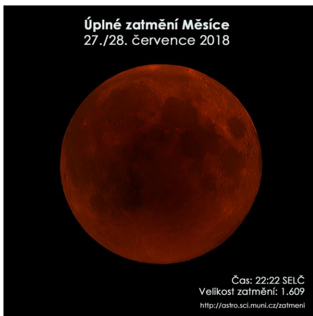
Simulační snímek maximální fáze měsíčního ztmění 27. července 2018.