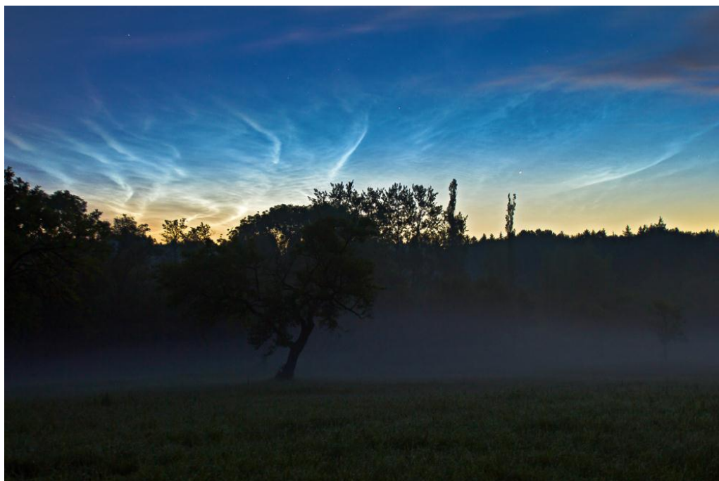
Noční svítící oblaka zachycená za rozbřesku 15. června 2012 na louce observatoře v Ondřejově.

Česká astronomická společnost (ČAS) vydává od května 1998 tisková prohlášení o aktuálních astronomických událostech a událostech s astronomií souvisejících. Počínaje tiskovým prohlášením č. 67 ze dne 23. 10. 2004 jsou některá tisková prohlášení vydávána jako společná s Astronomickým ústavem Akademie věd ČR, v. v. i. Archiv tiskových prohlášení a další informace nejen pro novináře lze najít na adrese http://www.astro.cz/sluzby.html . S technickými a organizačními záležitostmi ohledně tiskových prohlášení se obraťte na tiskového tajemníka ČAS Pavla Suchana na adrese Astronomický ústav AV ČR, v. v. i., Boční II/1401, 141 31 Praha 4, tel.: 226 258 411, e-mail: suchan@astro.cz .